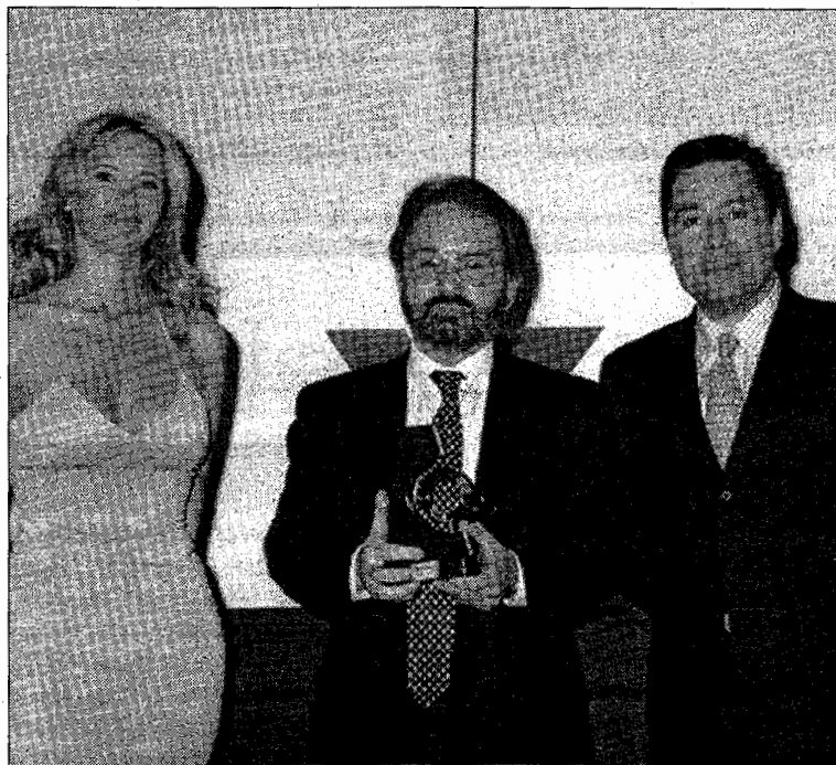
Escritor tardío, Canabal trabaja también en el sector inmobiliario.